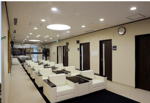
空港のラウンジのような ゆったりとした待合室